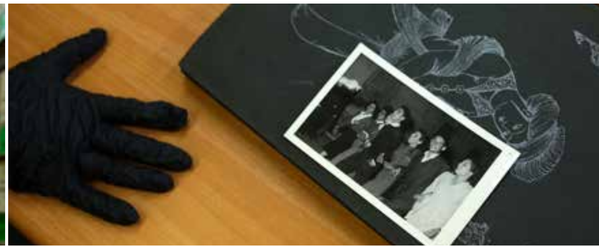
בתוך הארכיון