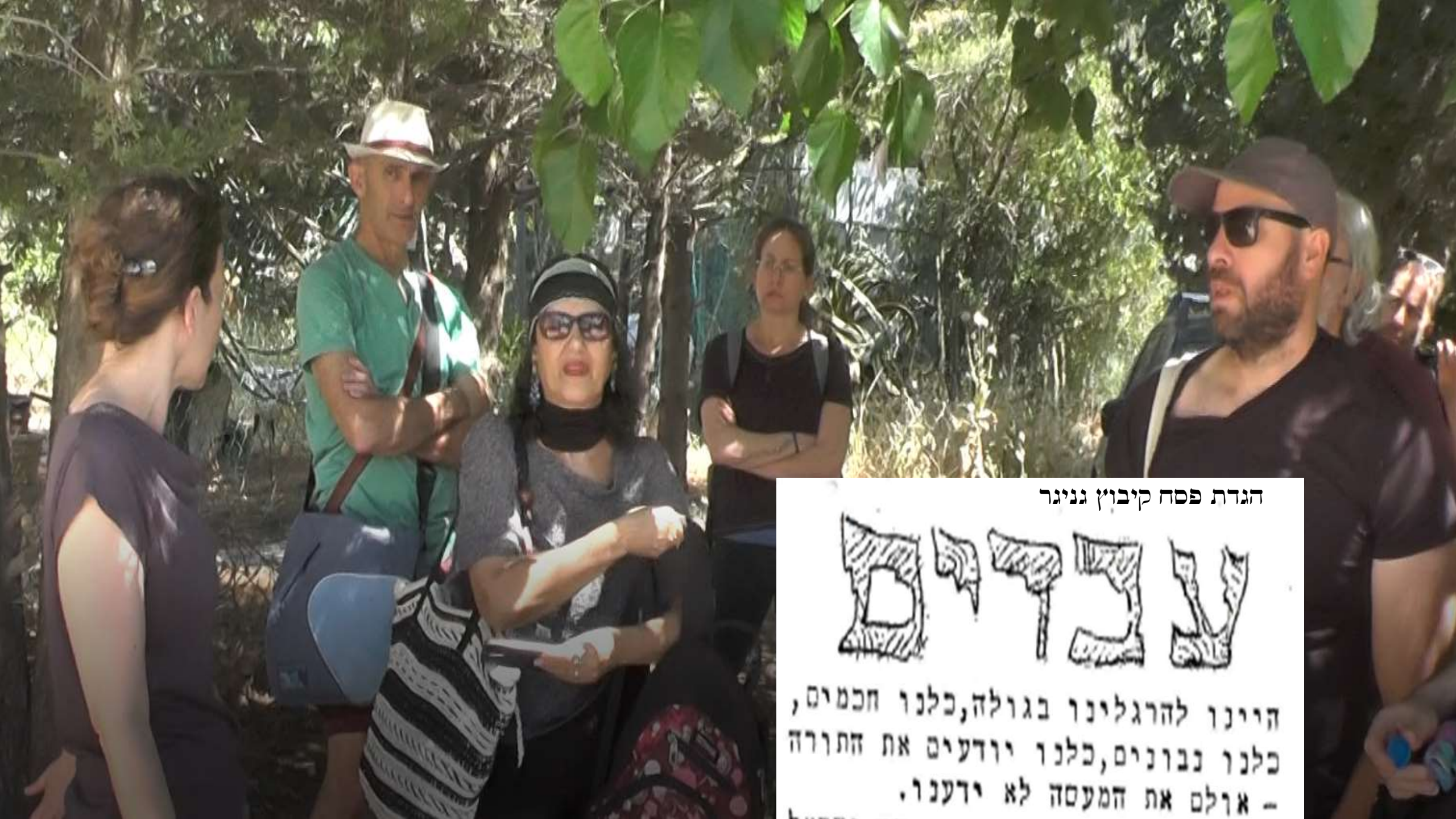
הגדת פסח קיבוץ גניגר